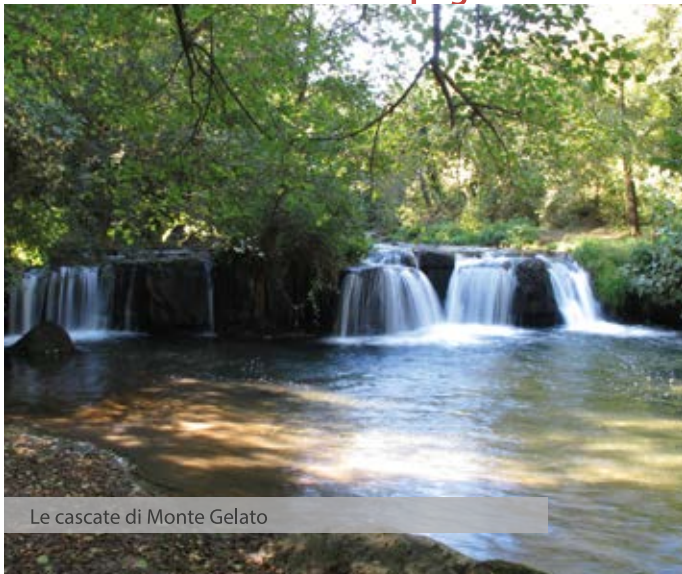
Le cascate di Monte Gelato